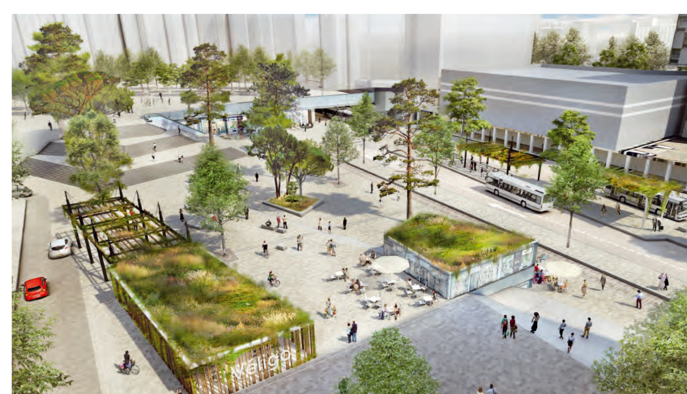
Amélioration du pôle d'échange multimodal du Grand Centre