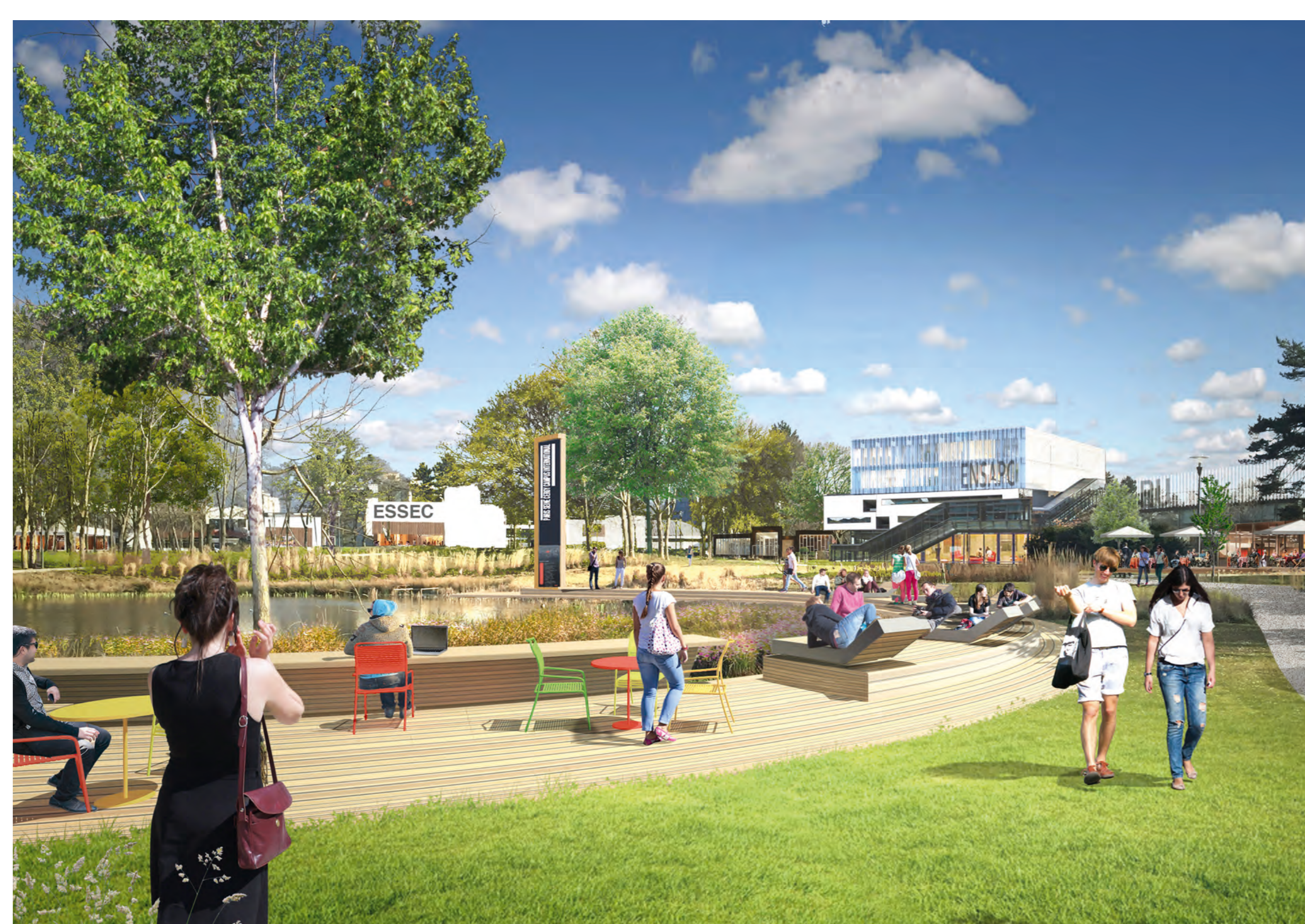
Le Parc François Mitterrand, cœur du futur Campus international

Avec plus de 208 000 habitants*, 90 000 emplois et 30 000 étudiants, Cergy-Pontoise est résolument un pôle structurant et attractif de la région Île-de-France. Le territoire offre les conditions d'un développement durable à travers ses principes de mixité urbaine et sociale , d'équilibre emplois/logements et d'une croissance urbaine, avec une moyenne de 1 650 logements construits par an.