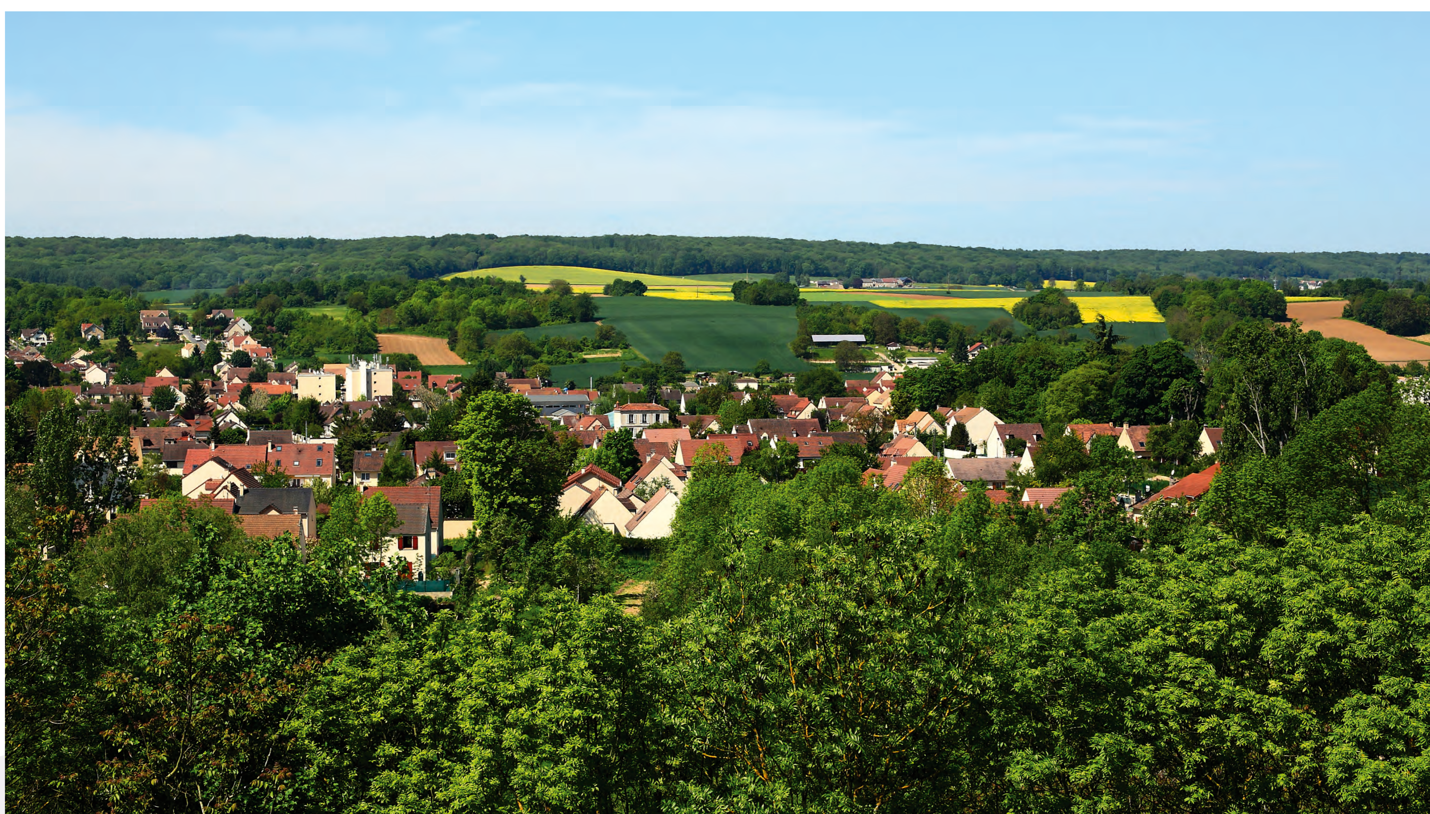
La commune de Maurecourt a rejoint l'agglomération en 2012